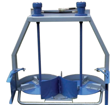
Tableau descriptif technique épandeurs de fertilisants

Disques ø 550 mm Nombre de disques : 2 Nombre de pales : 4 par disque Entraînement par moteur hydraulique 50 cm³ Diviseur central réglable Volet de localisation réglable Barre de protection des disques Carter de protection des disques Vitesse de rotation 700 tours/min. Largeur d'épandage de 0,60 à 10 mètres Démontage rapide