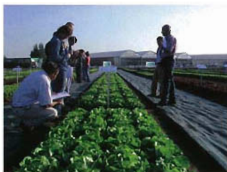
Plateforme recherche 2008.

V erte, blonde, rouge, mini, jeune, adulte, beurre, romaine, batavia, iceberg, feuille de chêne, multi-feuilles, lollo : la salade est plurielle, à plus d'un titre, et les laitues ne cessent d'évoluer pour faire face aux évolutions sanitaires. Alors la famille laitue Vilmorin s'agrandit : une recherche renforcée pour élargir les gammes et ainsi répondre au marché et anticiper les besoins des producteurs, pépiniéristes, industriels et consommateurs.