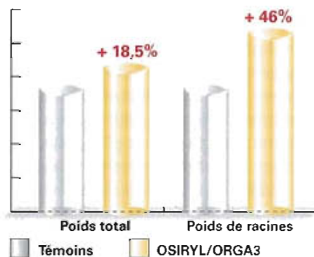
Variation du poids total et du poids de racines de plants de laitue traités avec OSIRYL/ORG3 et témoins non traités

Plus d'infos sur www.groupe-frayssinet.fr