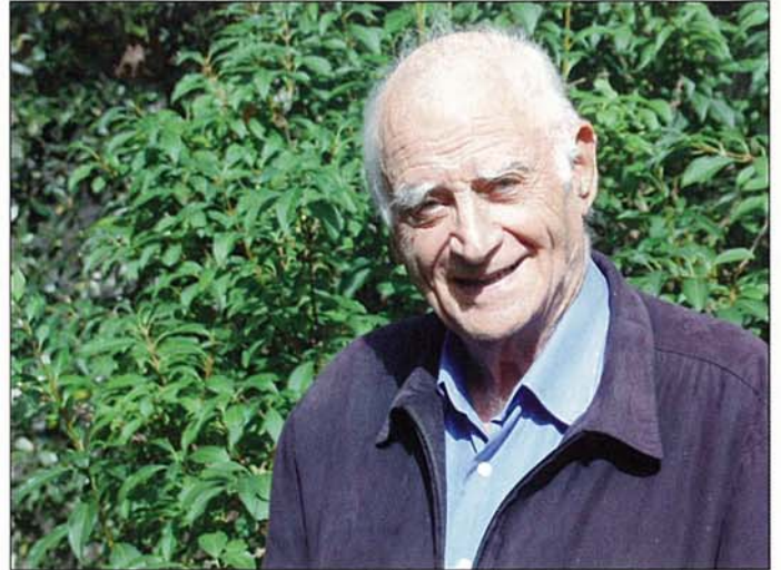
« La notion d'échange tisse du lien social, celle du capital crée de l'adversité ».

actuelle. Pour le philosophe, l'importance d'un événement se mesure à la longueur de l'ère qu'il achève. Celle concernant, l'agriculture, c'est-à-dire les liens entre l'Homme et la Terre remonte à 8 000 ans avant JC. Aussi, la crise économique et financière ne serait donc qu'un signe avant-coureur d'un séisme beaucoup